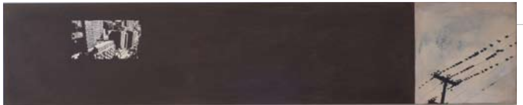
trying to forget , Gesso en olie op hout, 200 x 40 cm, 2008