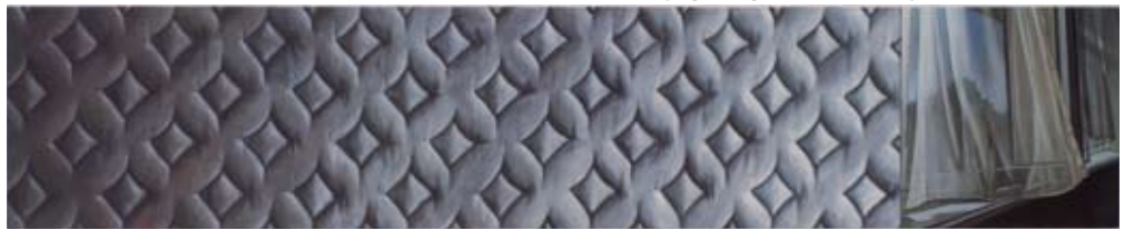
the bed we made , Gesso en olie op hout, 200 x 40 cm, 2008

✦ Bronwen skilder voorwerpe uit haar omgewing op gesso-doek – 'n Donker laag onder, 'n ligter een bo-oor. Dié dam sy dan met skuurpapier by, sodat dit lyk of die beeld uit lae van die aarde opstaan. Soos iets wat deur tyd verweer en opgegrawe is. Haar beeldspraak “spreek sowel die fisieke as emosionele ruimte wat mense inneem aan”. Hierdie ruimtes, sê sy, vorm ons identiteit op 'n persoonlike en sosio-politieke vlak.