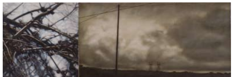
Last Hour , Olie op doek, 210 x 70 cm, 2008