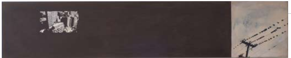
trying to forget , Gesso en olie op hout, 200 x 40 cm, 2008