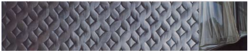
the bed we made , Gesso en olie op hout, 200 x 40 cm, 2008