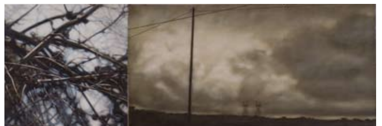
Last Hour , Olie op doek, 210 x 70 cm, 2008